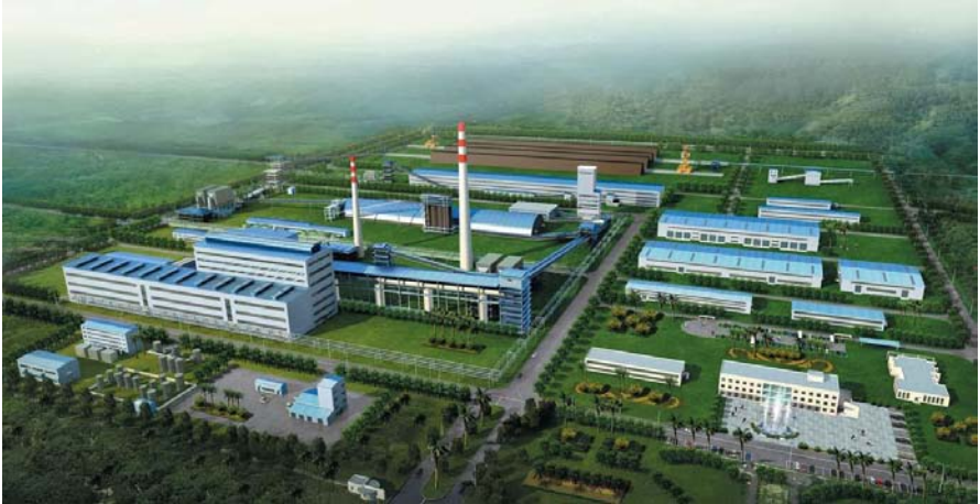
最大中资企业（投资项目）——达贡山镍矿冶炼厂效果图

部统计，2010年中国对缅甸直接投资额为3.28亿美元。据缅甸方统计，截至2010年12月31日，中国（含香港、澳门）对缅甸投资位列第一。其中，电力投资53.12亿美元、石油天然气投资49.54亿美元、矿业投资18.77亿美元，制造业投资1.3亿美元，畜牧业和渔业投资0.03亿美元，酒店和旅游业投资0.39亿美元，交通运输业投资0.06亿美元，服务业投资0.03亿美元。