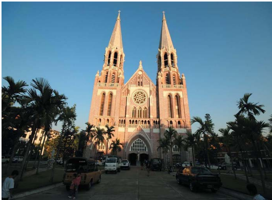
仰光圣玛丽娅教堂

【禁忌】缅甸为佛教国家，视佛塔、寺庙为圣地，任何人上至国家元首、外国贵宾，下至平民百姓，进入佛寺一律赤脚，否则将被视为对佛教不敬。缅甸人忌讳抚摸小孩的头。小孩双手交叉胸前，表示对大人的尊敬。