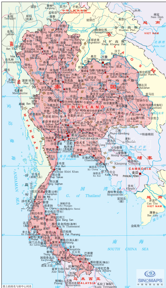
图上的府名与府中心同名