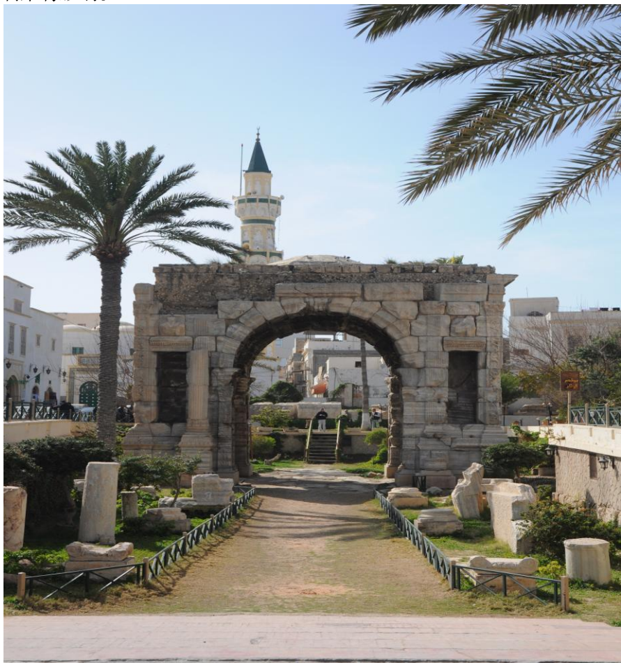
的黎波里市中心古城清真寺

民风受伊斯兰教思想影响,较为保守,尤忌与利女性单独交谈,除一般违禁品外,酒、猪肉等禁止携入境。社会阶级意识不强烈,见面时不分阶级皆以握手为礼。政治敏感度高,在利必须谨言慎行,避免和陌生人谈及政治。与官方机构往来函件必须使用阿拉伯文。在利比亚安排会晤要尽量提前,并准时到达。但利比亚人对时间的运用很灵活,他们并不很遵守时间表上的安排。利比亚烹饪融合了阿拉伯和地中海的烹饪风格,并深受意大利菜肴影响。