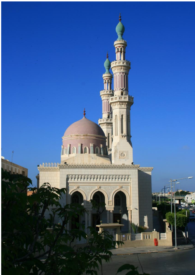
利比亚穆罕默德清真寺