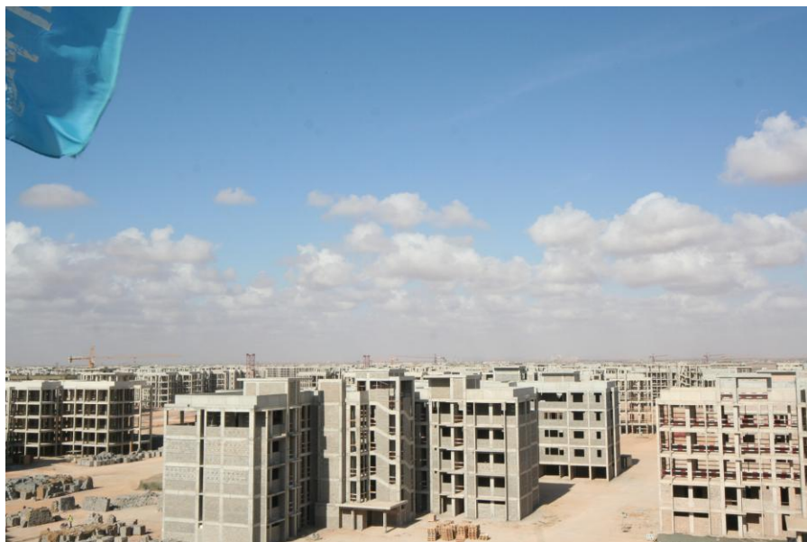
中建利比亚班加西富德15000套住宅工程施工现场

【石油合作】目前，中石油集团下属的6家石油企业和中海油集团下的1家企业先后到利比亚开拓业务。其中，中石油东方物理勘探公司(BGP)在利比亚市场份额已遥遥领先，目前约占40%，中石油管道局2002年以来也一直承担着利比亚重要的油气管道输送项目。