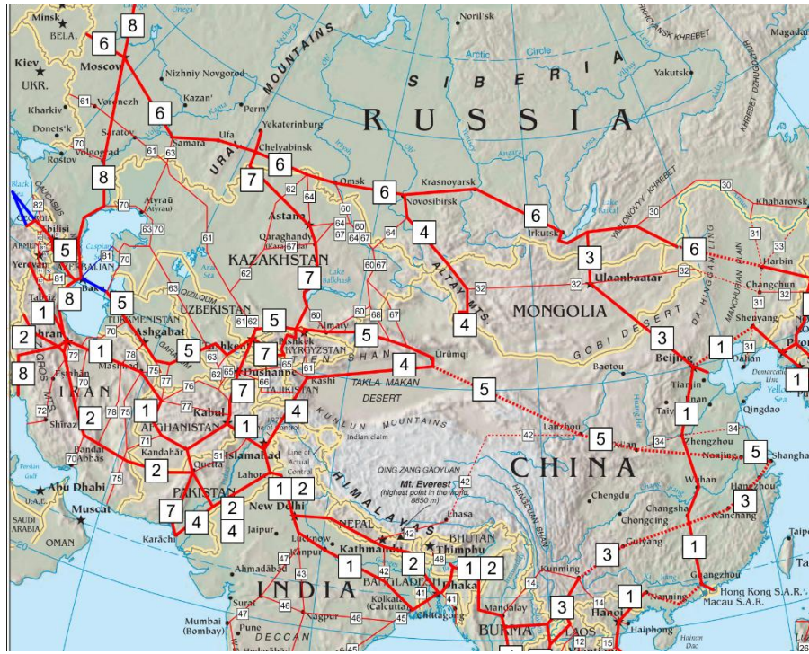
图 2 泛亚公路示意图