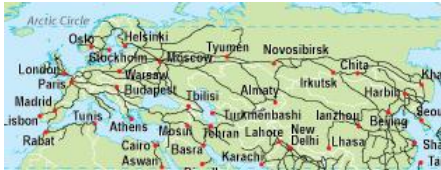
图 1 欧亚铁路网示意图